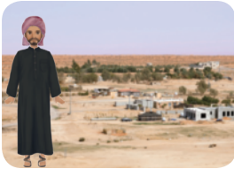
▲ 모래바람이 부는 고장