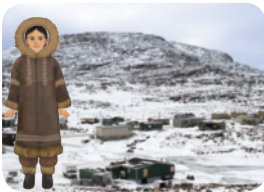
▲ 춥고 눈이 많이 오는 고장