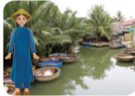
▲ 덥고 습한 고장