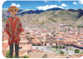
▲ 낮과 밤의 기온 차가 큰 고장