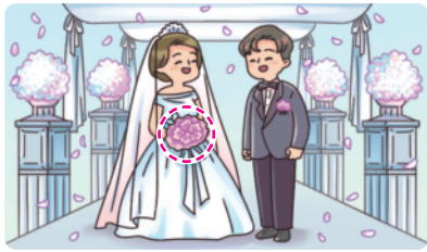
▲ 오늘날의 결혼식에서 신부가 든 부케