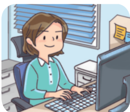
▲ 회사에서 일하기