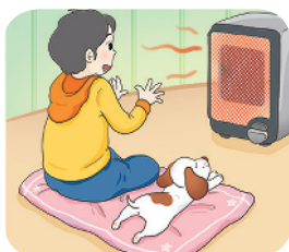
▲ 난로 사용하기