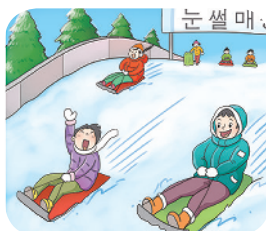
▲ 눈썰매 타기