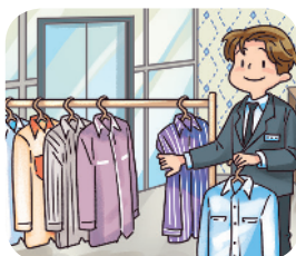
▲ 백화점에서 물건 팔기