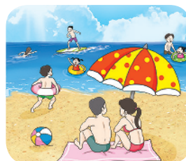
▲ 해수욕 즐기기

5 여름에는 더위를 피하기 위해 해수욕을 즐기며 에어컨이나 선풍기 등을 사용합니다.