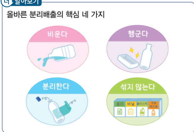
올바른 분리배출의 핵심 네 가지