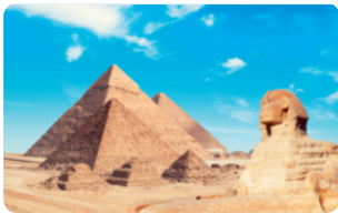
▲ 이집트의 피라미드와 �핑크스

12 유럽 대륙의 남쪽에 있는 아프리카는 인도양, 대서양과 접해 있습니다. 아프리카에는 이집트, 나이지리아, 탄자니아 등의 나라가 속해 있습니다.