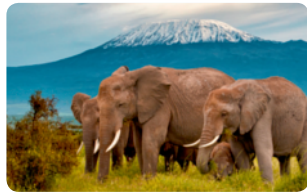
▲ 탄자니아의 세렝게티 국립 공원

13 유럽은 아시아 대륙의 서쪽에 위치한 대륙으로 남쪽에는 아프리카 대륙이 있고, 북극해, 대서양과 접합니다. 유럽 대륙은 다른 대륙에 비교해 면적은 좁은 편이지만 프랑스, 독일, 스웨덴, 이탈리아, 폴란드, 루마니아, 핀란드, 노르웨이, 그리스 등 많은 나라가 있습니다.