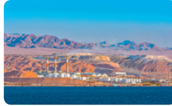
◀ 사우디아라비아의 원유를 생산하는 시설