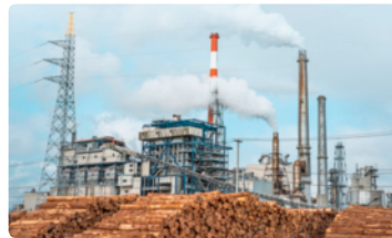
◀ 종이를 만드는 공업이 발달한 냉대 기후 지역